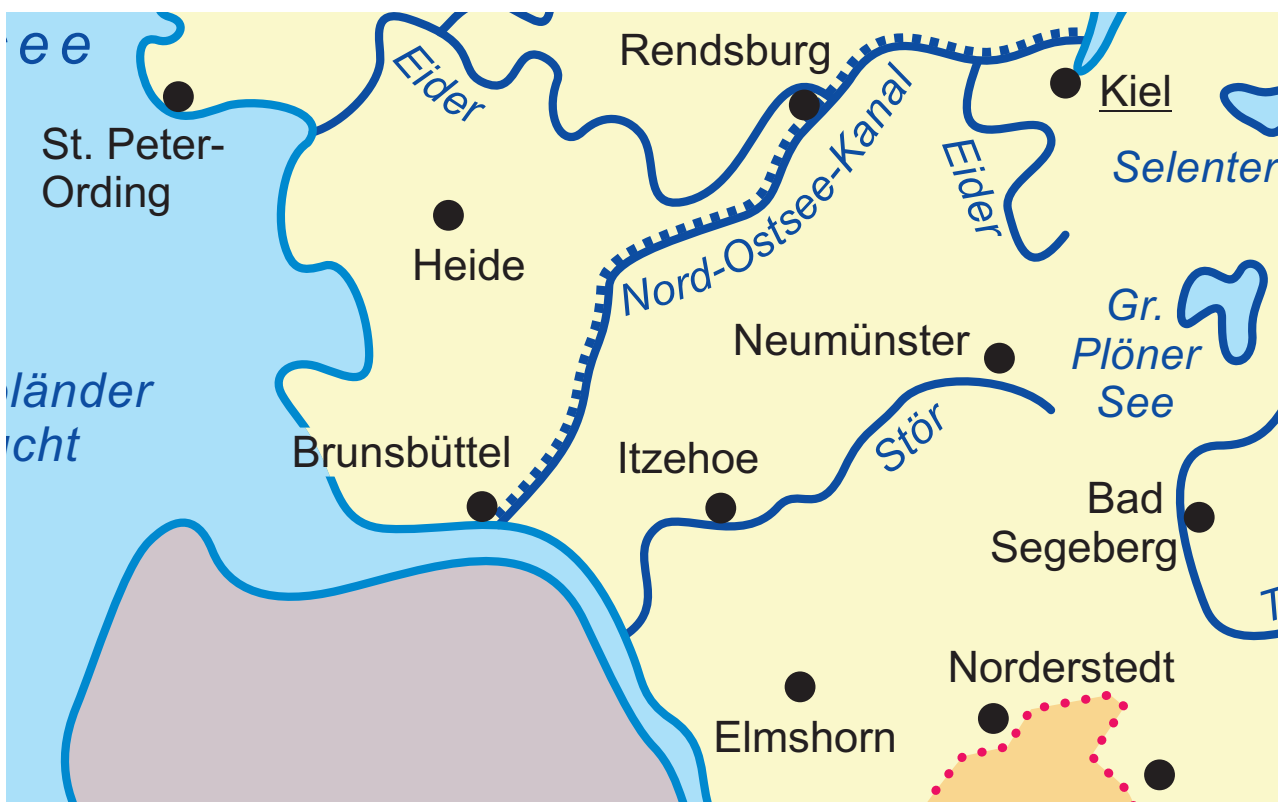
Ausschnitt aus einer Karte des Deutschland-Atlas